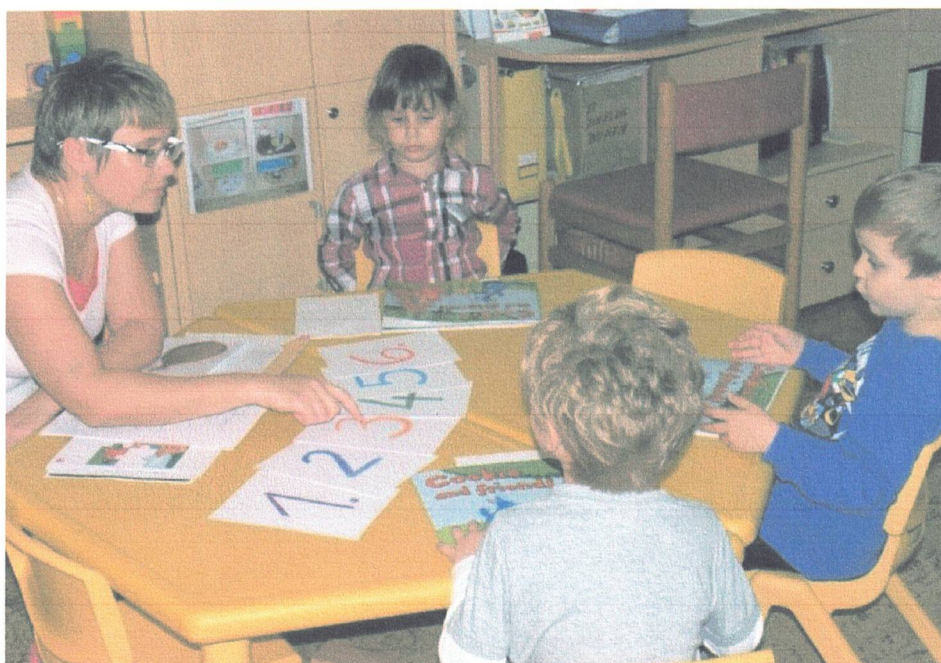
ANGLIČTINA PRO DĚTI