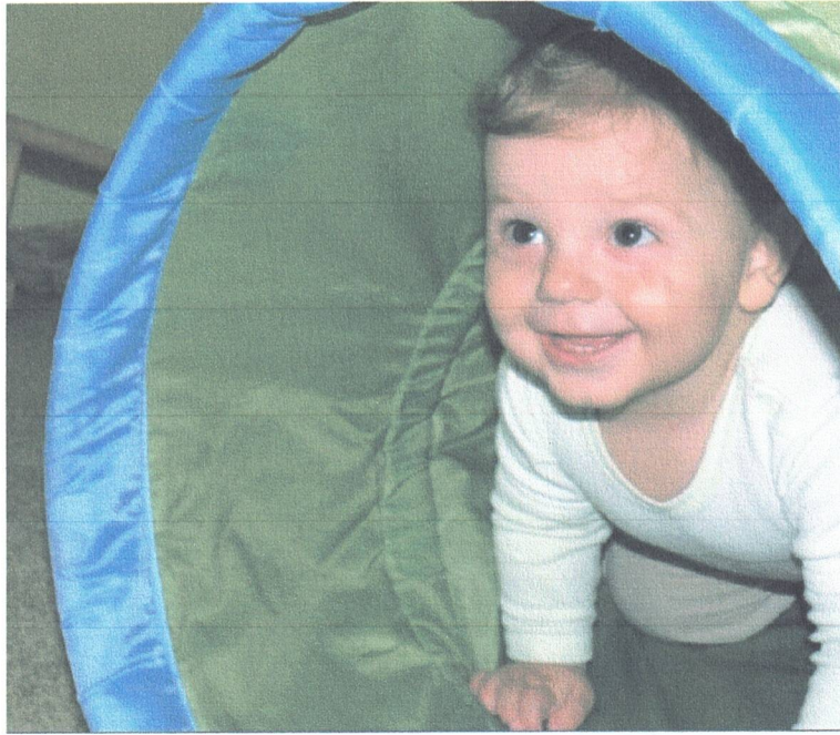
Cvičení pro rodiče s kojenci a batolaty