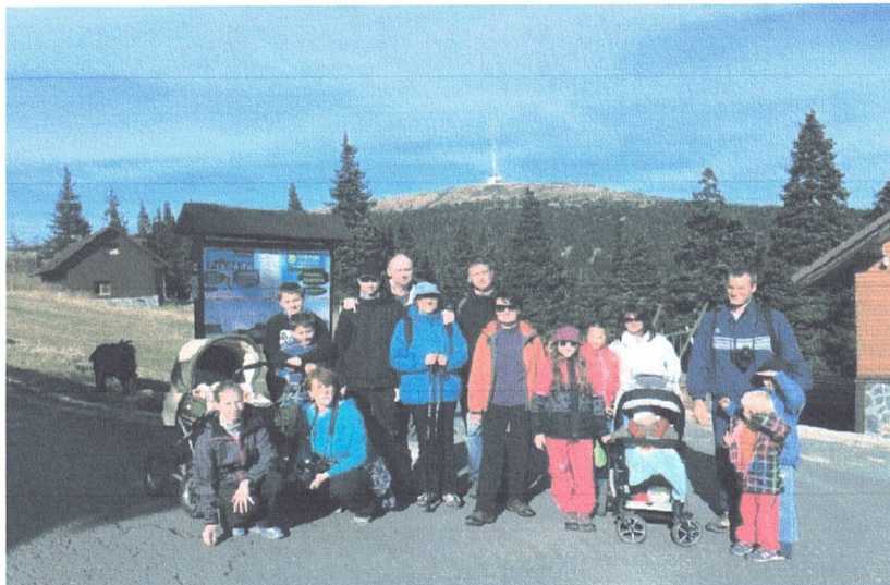
VÍKENDOVÝ POBYT V JESENÍKÁCH