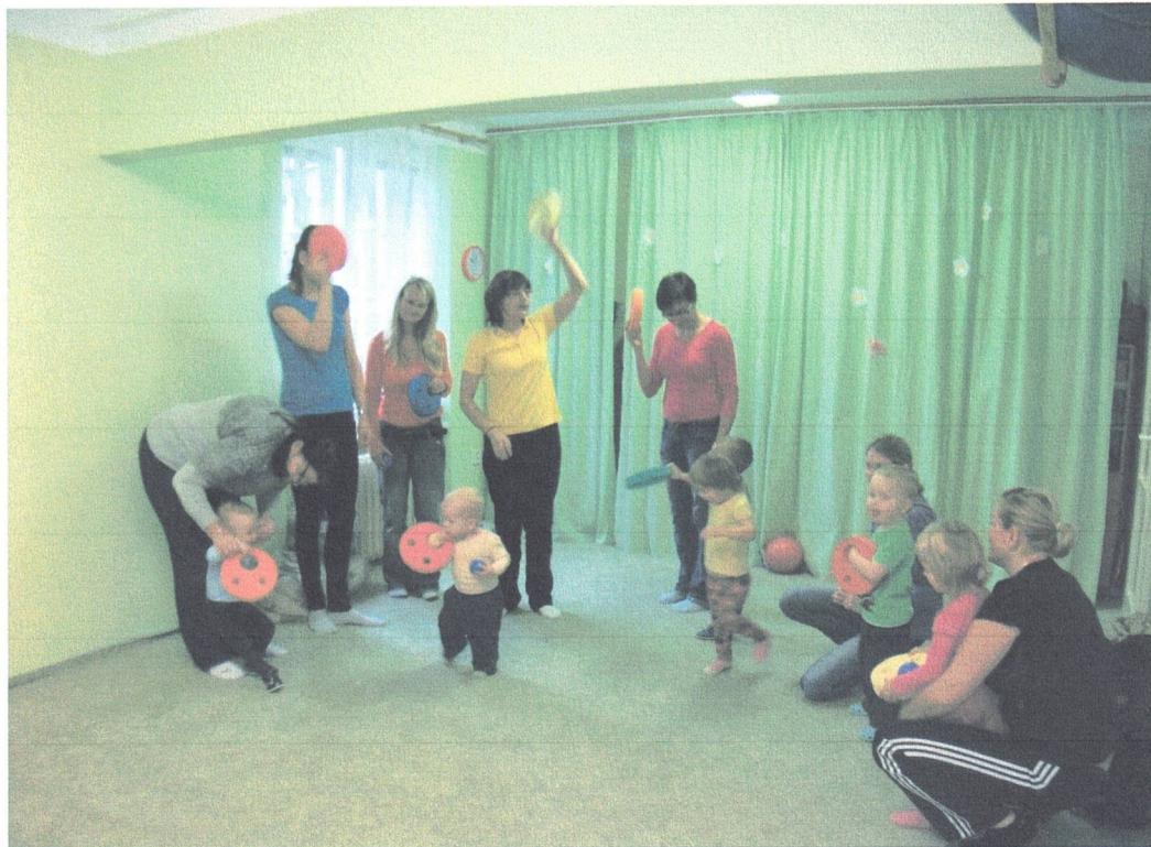
Páteční cvičení pro maminky s batolaty - říkanky s pohybem