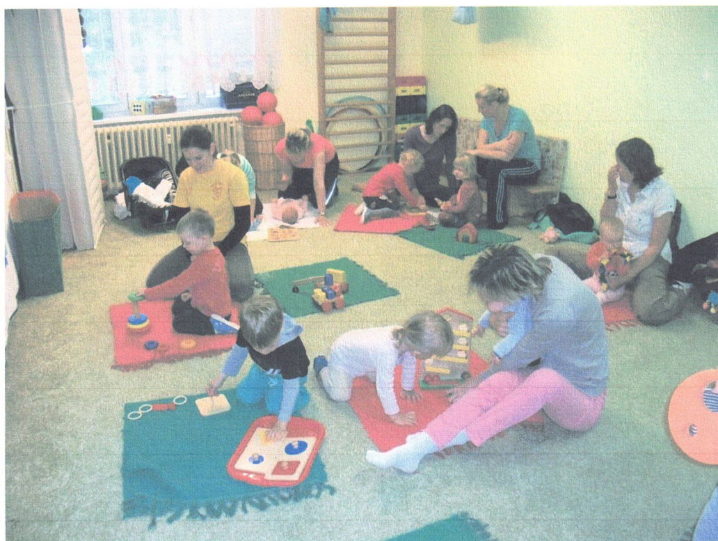
Hrátky s montessori – beseda, ukázka