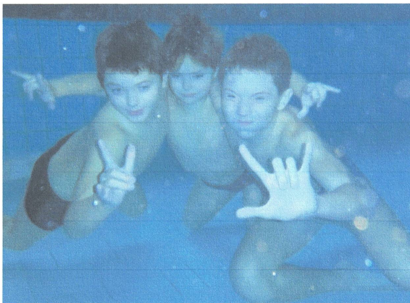
VÍKENDOVÝ POBYT S PLAVÁNÍM