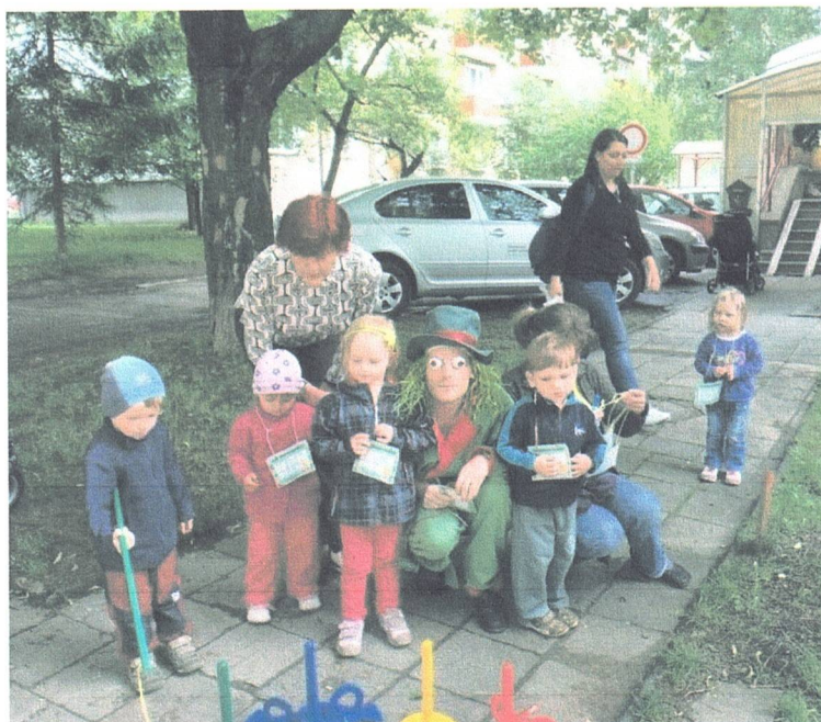
ZAHRADNÍ SLAVNOST A DEN OTEVŘENÝCH DVEŘÍ