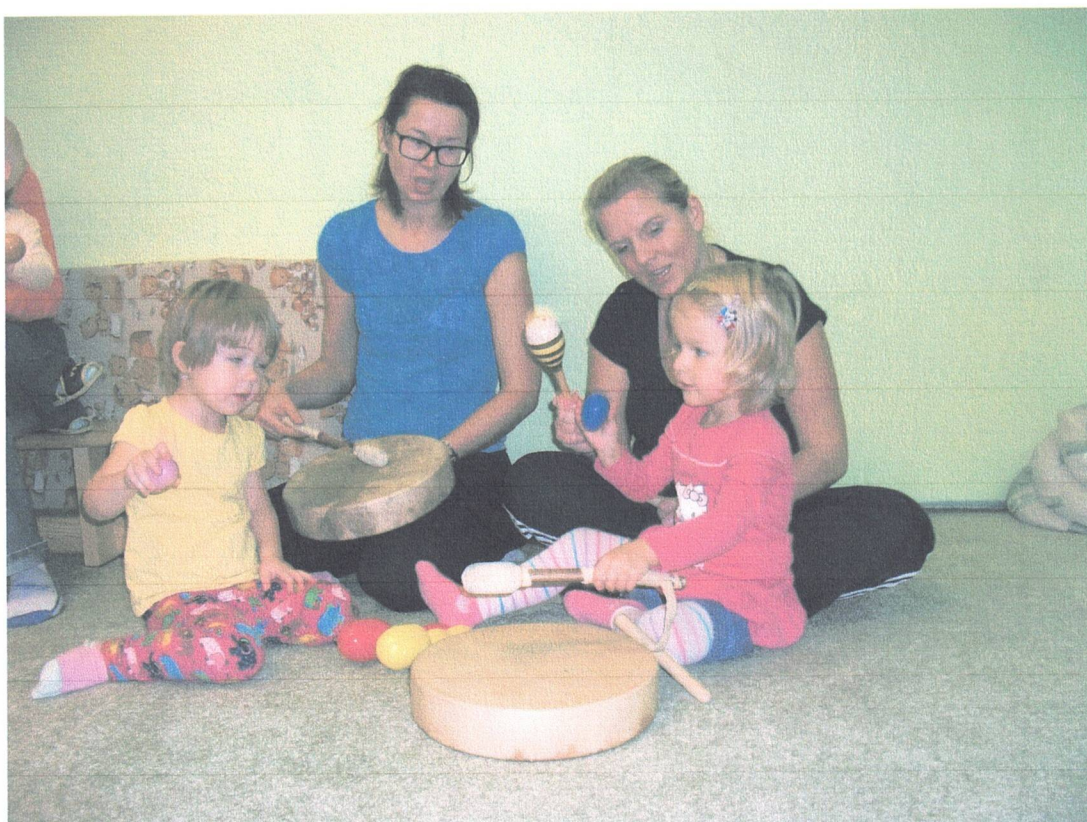
Páteční cvičení – hudební hrátky