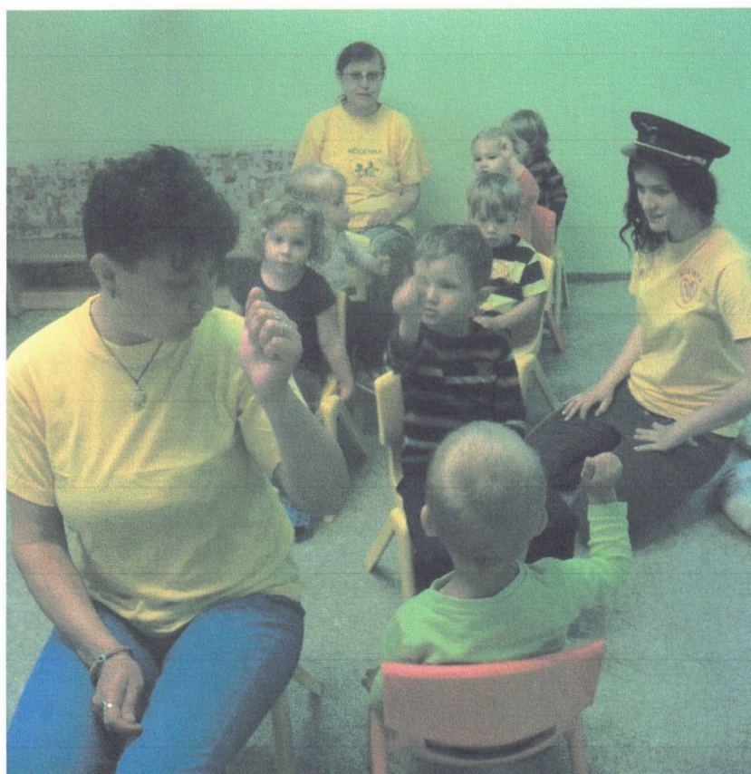
Miniškolka – hrajeme si na výletníky