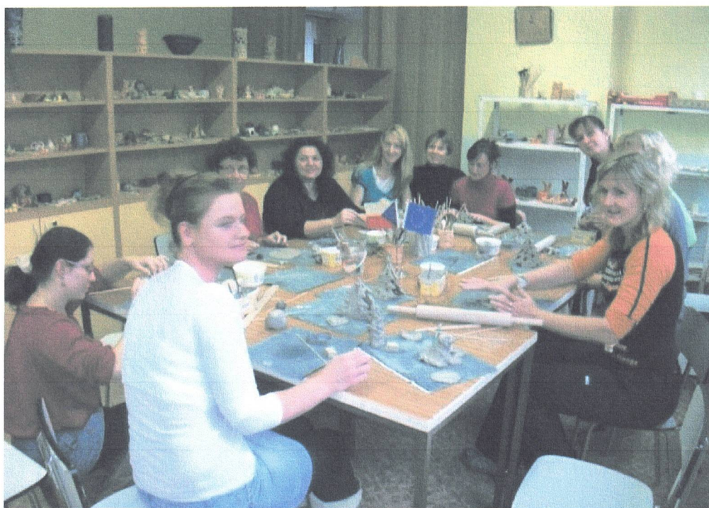
Kurz Pečovatelka – praktická část - terapie