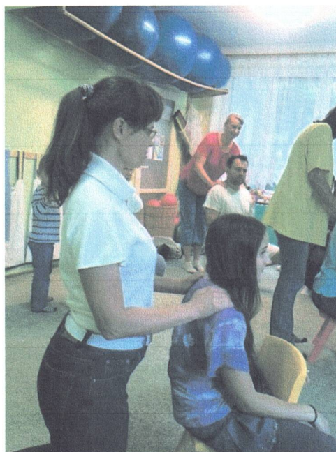
MASÁŽE DO ŠKOL