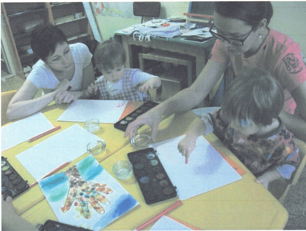
výtvarné tvoření v rámci pátečního cvičení maminek s batolaty