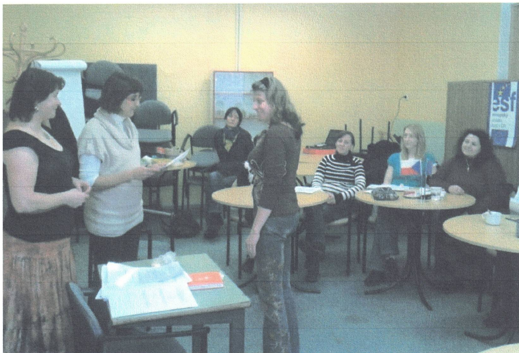
Rekvalifikační kurz Pečovatelka v sociální oblasti – předávání osvědčení