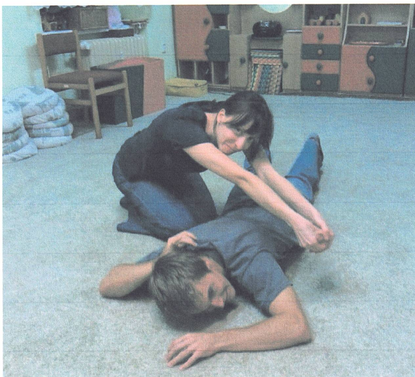
Kroužek divadelní improvizace