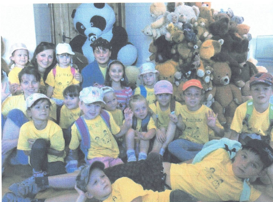
PŘÍMĚSTSKÝ TÁBOR S ANGLIČTINOU