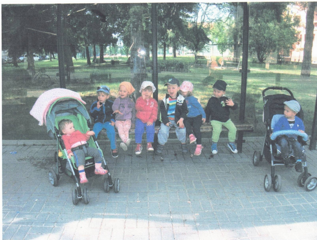
Miniškolka – jedem na výlet