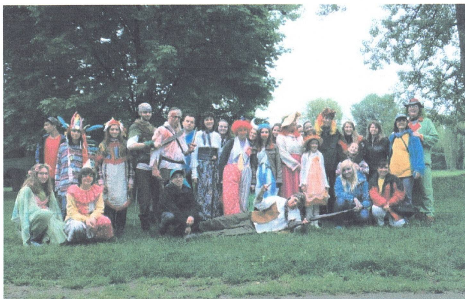
MÍLE PRO MÁMU – POHÁDKOVÝ PARK