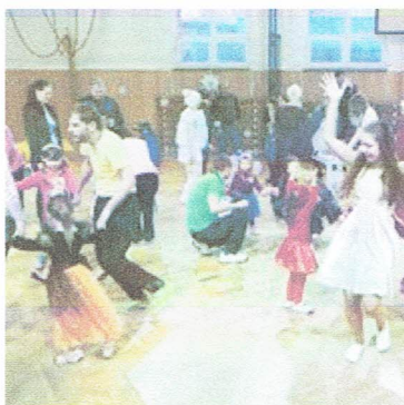
Maškarní s Olafem