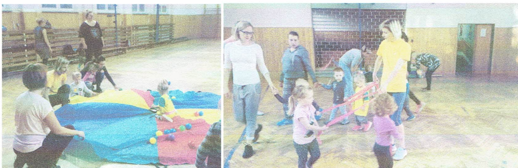
Tělocvičení s Rodinkou