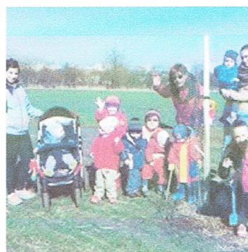
Vycházka jarní přírodou