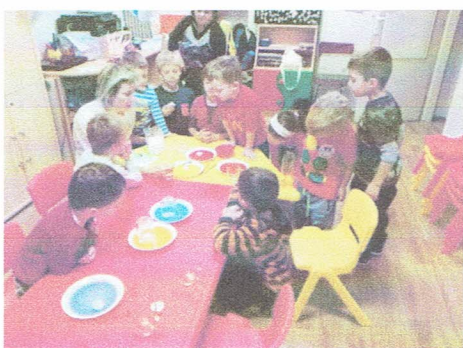
Kroužek Malý badatel