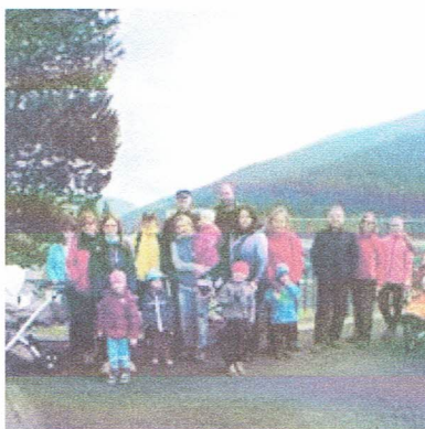
Pobyt na Morávce