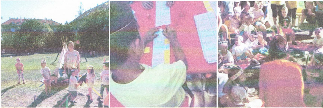
Indiánská slavnost Rovnodennosti